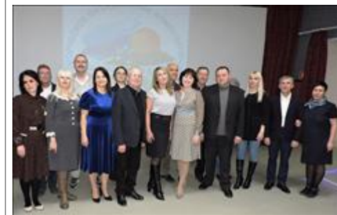
Партнёры проекта, участники мини-презентации 5 марта 2019 года кинозал "Премьера"