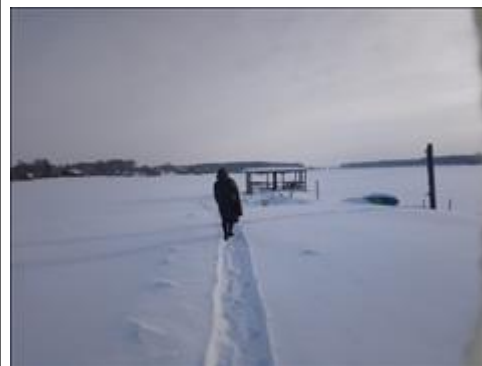
Выезд рабочей группы 5.02.2019 Определение места размещения сцены