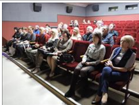
Приглашённые на мини-презентацию Присутствовало 60 человек