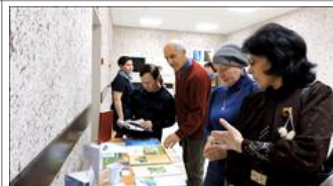
Выставка печатной продукции "Песни иткульского лета" Все желающие смогли посмотреть образцы печатной продукции, нотные сборники, атрибуты фестиваля